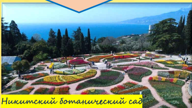
Никитский ботанический сад

На полуострове немало исторических, архитектурных и природных достопримечательностей, значительная часть которых является памятниками мирового значения. Самые известные из них, – Никитский ботанический сад, Алушкинский государственный дворцово-парковый музей-заповедник, Бахчисарайский государственный историко-архитектурный заповедник и государственный архитектурно-исторический заповедник «Судакская крепость» в городе Судак.