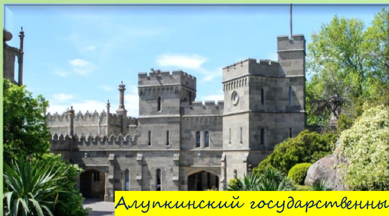
Алушкинский государственный дворцово-парковый музей-заповедник