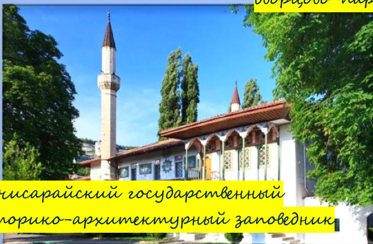
Бахчисарайский государственный историко-архитектурный заповедник