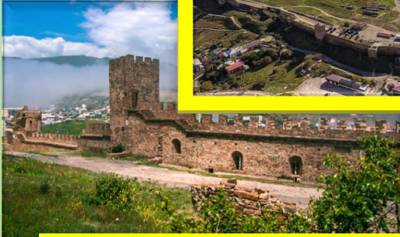
Государственный архитектурно-исторический заповедник «Судакская крепость» в городе Судак.

Крым сегодня является одним из ведущих направлений развития туризма. Его леса, водопады, пещеры, минеральные источники, грязевые озёра представляют особую ценность и как уникальнейшие природные объекты, и как весомые факторы, оказывающие существенное влияние на экологию как полуострова, так и Европы в целом.